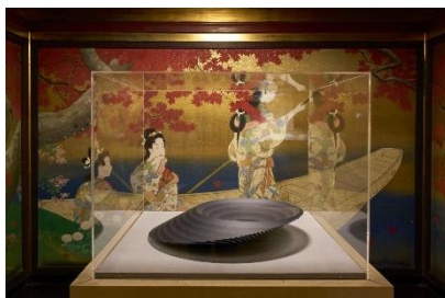
満月の夜に水面に映る月の光とさざ波 (小島 有香子 作)