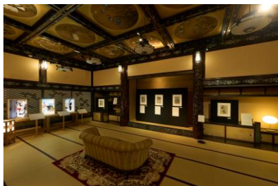
約 130 年前の作品を堪能