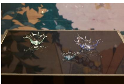
水をテーマにした繊細なガラス作品も (ゆきあかり 作)