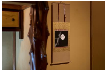
文化財建築に溶け込む月と稲妻の神秘 (岩谷 晃太 作)