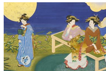
ポストカードイメージ

※当日会場受付で購入の場合のみ割引適用。オンラインでのチケット購入は対象外となります。