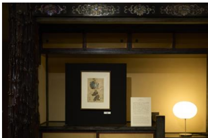
竹取物語のラストシーンを表した 『月宮迎 竹とり』

浮世絵に使われている紙や絵具は繊細で、強い光が当たると色が褪せてしまうため展示室では暗さが必要になります。その本来の正統的な展示で、浮世絵師・月岡 芳年の晩年の連作「月百姿」より 20 点を前後期に分けてお楽しみいただきます。彫りや刷りの美しさや、大胆で迫力のある構図、しみわたる月の静けさを感じながらお過ごしください。また、作品を和紙に転写し、下から明かりを照らす展示も。日頃、美術館などで目にする浮世絵とは違った視点で楽しむ「月百姿」は、本展ならではの演出です。