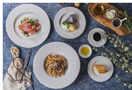
CANOVIANO CAFE 料理イメージ

【URL】 https://www.hotelgajoen-tokyo.com/archives/99315