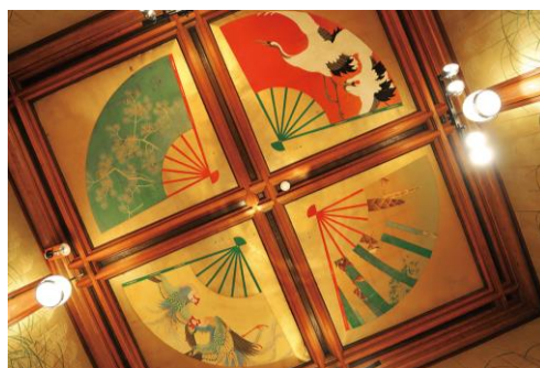
天井に吉祥の絵柄が施された「静水の間」

年に5~6回の企画展開催時に公開している東京都指定有形文化財「百段階段」は、芸術家、大工、職人などあらゆる分野の超絶技巧で埋め尽くされた建物です。今回は、文化財そのものの魅力を隅々までご覧いただける貴重な機会。建設当時は、披露宴も行われる料亭の宴会場として使われていたため、良縁や富貴、健康などの吉祥の意味が込められたデザインが多くみられ、新年のお出かけにもおすすめです。