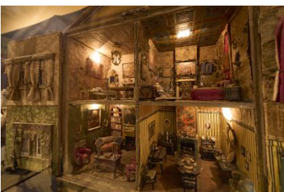
1700年代後半のドールハウス

身近な食品や、いつも持ち歩いているコスメ、日本の街の風景など、日頃見慣れた物や景色をそのまま縮小したような再現性の高い現代作品や、イギリスで1700年代後半に作られたドールハウス、元建築士という経歴を生かし、遠近法を用いてつくられたミニチュアハウスなど、ジャンルの異なるおよそ1,150点の作品を一挙公開。顔を近づけ、目を凝らし、その精緻な技を鑑賞したり、はるか天空から景色を眺めているような感覚で、俯瞰して全体を見渡したりと、さまざまな視点で愉しめるのも、ミニチュアの魅力のひとつです。テーマの異なる会場を巡りながら、ご自身の楽しみ方を見つけてみてください。