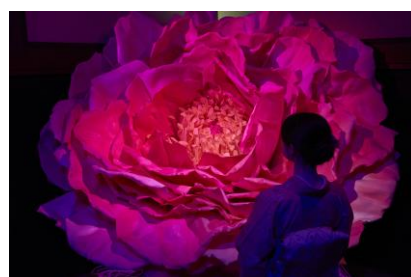
巨大な芍薬から始まる物語