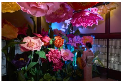
花畑に迷い込んだような1枚を

不朽の名作「不思議の国のアリス」をモチーフに、ジャイアントフラワーアーティストMEGUにより表現された日本版「Alice in “Wa”nderland」は、暖簾をくぐると、直径約2.5mもの大きな芍薬がお出迎え。先へ進むと、自分自身が小さくなり花畑の中に迷い込んだような空間が広がります。花の香りに包まれながら歩みを進めると、今度は路地裏BOOKSHELF作家 mondeによる文庫サイズの不思議の国のアリスの一場面が現れ、体がちいさくなったり大きくなったりする感覚に陥ります。おとぎばなしの中に入り込んだような錯覚を引き起こす不思議な空間は、フォトスポットとしてもおすすめです。