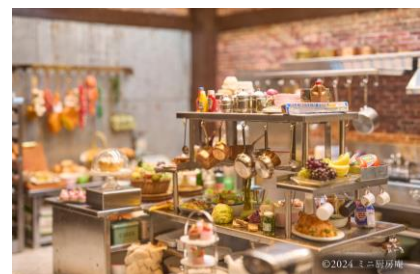
食材や調理器具が忠実に再現された厨房