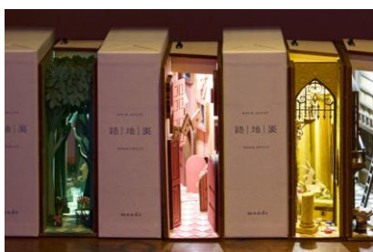
文庫本サイズのアリスの世界