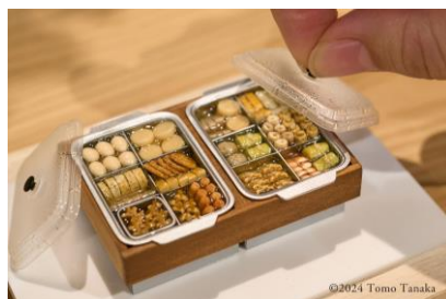
蓋の水滴にも注目してほしいおでん