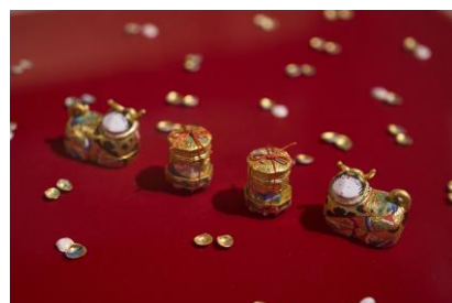
源氏物語が描かれた合わせ貝など